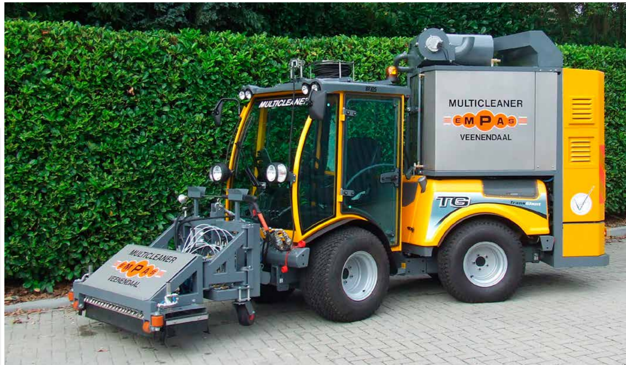
MC OP KÄRCHER MIC84

De unit is zeer solide en verzet het meeste werk op jaarbasis (in vergelijking met andere types). Speciaal voor de moeilijk bereikbare plaatsen is de MC voorzien van een RVS veerhaspel met een werkslang van twintig meter en een werkpistool met lans en vloeikop.