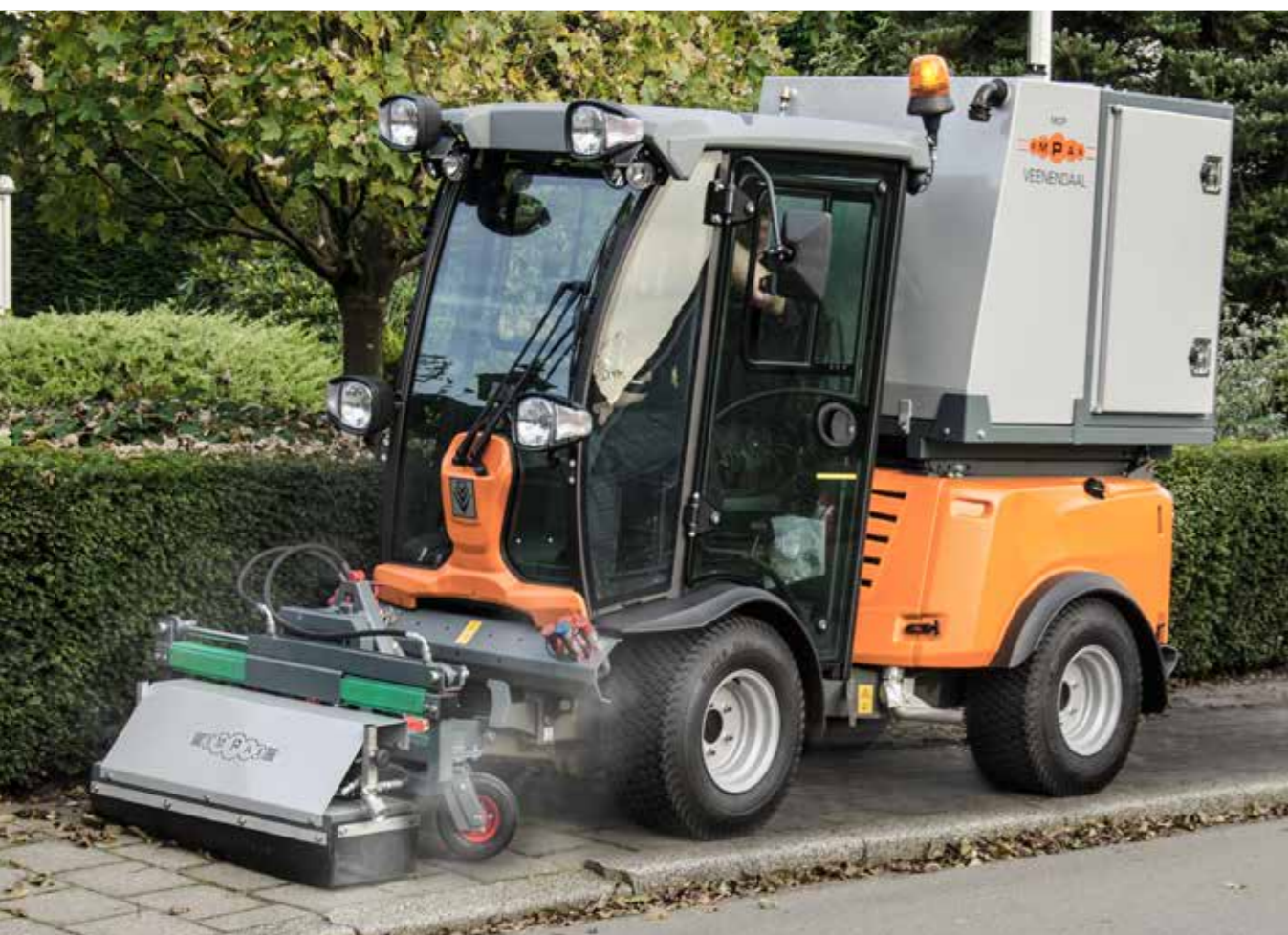
MCP OP KÄRCHER MIC50

De MCP-T, speciaal voor de tractor, is ontwikkeld om uw voertuig het jaar rond te bezetten. De PTO van de tractor drijft de hydromotor van de unit aan. De MCP-T heeft een eigen spanning en hydrovoorziening aan boord en is multifunctioneel inzetbaar. De MCP-T is zeer eenvoudig te verwisselen omdat de unit in de driepunt van de tractor hangt. Het voertuig is zo ook inzetbaar voor andere doeleinden, bijvoorbeeld gladheidsbestrijding.