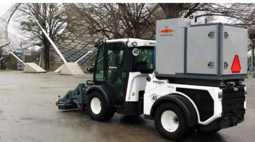
MCP OP MULTIHOG