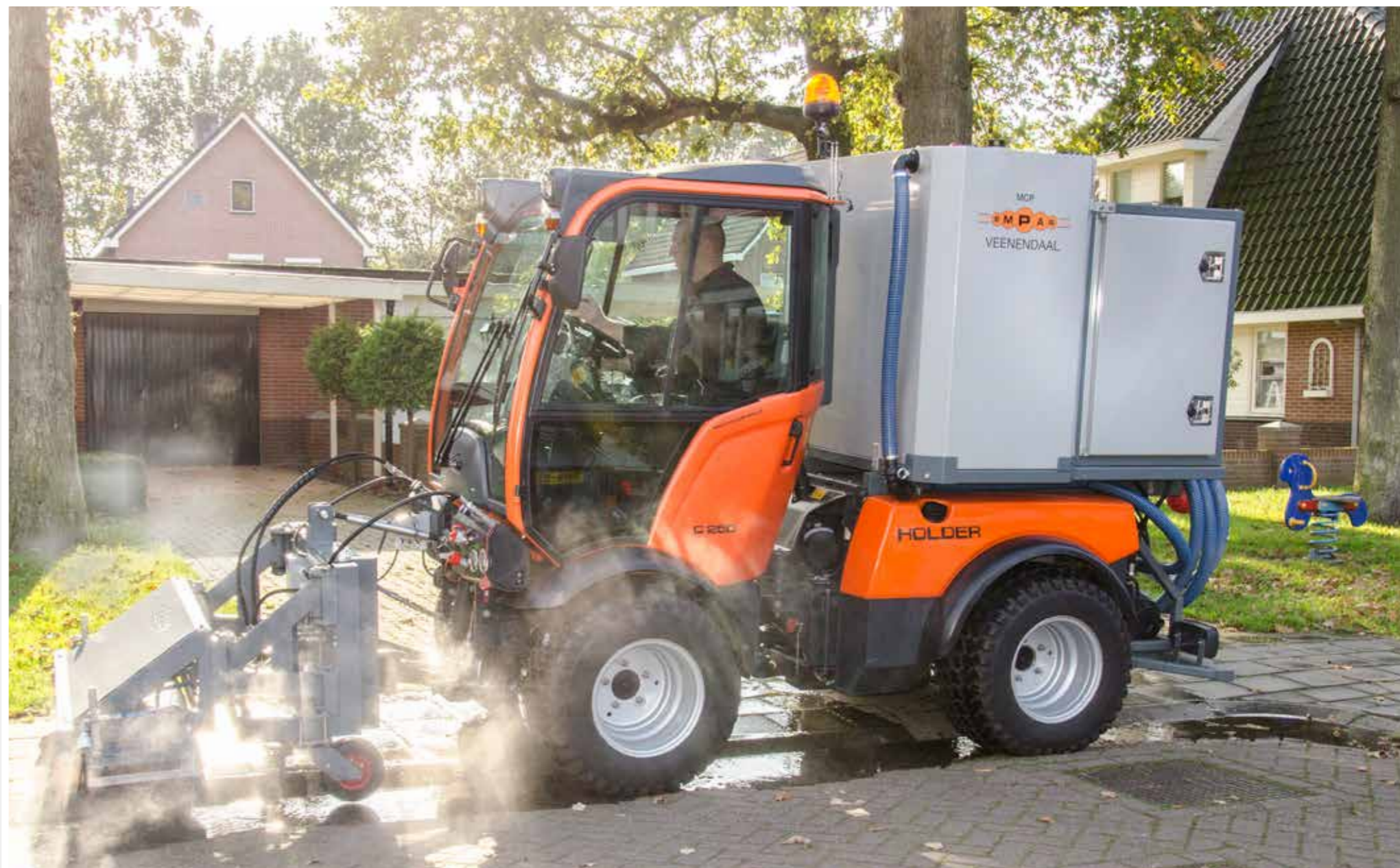
MCP OP HOLDER

De 140 centimeter brede werkbak kan naar links en rechts 25 centimeter uitwijken. Branderketels warmen het water in de MCP op tot een werktemperatuur van 102 °C. Dankzij warmtewisseling is er minder energie nodig voor de opwarming van het water. De maximale druk van de MCP is 120 bar ten behoeve van reiniging.