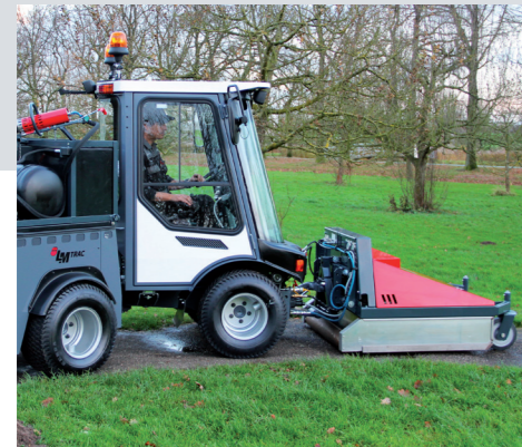
Geavanceerde brandertechnologie, gemonteerd op een comfortabele werktuigdrager.

Ook in het onderhoud is de WeedSteam zuinig: buiten het normale dagelijks onderhoud (waterfilter controleren en smeren) is éénmaal per jaar groot onderhoud voldoende. De solide constructie en de toepassing van hoogwaardige componenten staan borg voor een lange levensduur van de WeedSteam.