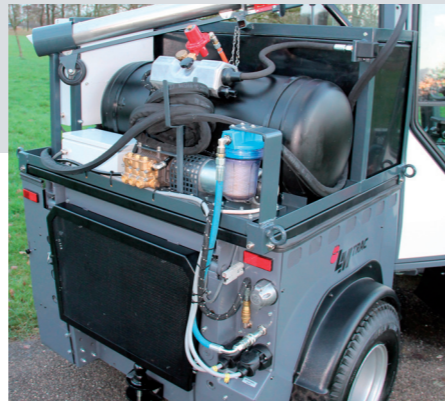
Minimaal onderhoud met maximale prestaties. Een duurzame totaaloplossing.