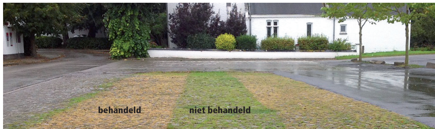
Resultaat na enkele dagen. Na een paar uur is er al verkleuring zichtbaar en na een paar dagen is de gehele behandelde vegetatie verdord.