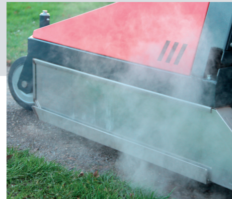
Effectieve methode door een combinatie van zeer hete lucht, infrarode straling en stoom.